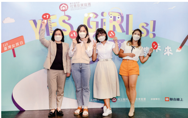
女孩日線上論壇，李麗芬政務次長（左）等人分享自身觀點與經驗。

李麗芬次長以「相信自己，勇敢築夢」這句話送給女孩，鼓勵女孩突破性別框架，遇到不平等對待及挫折時，可以勇敢表達自己的想法，更期望父母、同儕、師長及社會環境，不以性別來