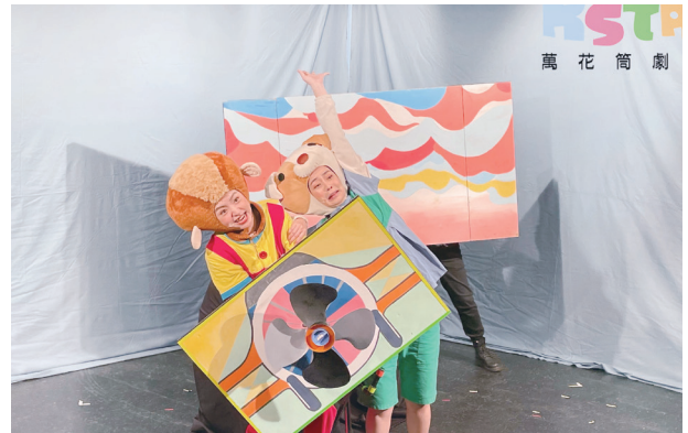
透過萬花筒劇團的戲劇演出，「我的未來方城市」傳達每位女孩都可以勇敢追夢，盡情擁抱生命。

限制女孩或男孩的機會及發展。曾經站上世界最高峰，以完登世界 14 座八千公尺高山為志業的詹喬愉，認為臺灣正處於性別平權思維的突破期，然而受制傳統思想，容易將問題歸咎於「妳是女生所以不行」，她認為，社會應該給予女性學習新事物的時間，而非剝奪她們學習的機會。詹喬愉也鼓勵年輕女孩追夢，為自己的選擇負責，更以自身經驗建議女孩們，不要認為自己還不夠好是負面的，就是因為知道還不夠好，才有往前的動力。