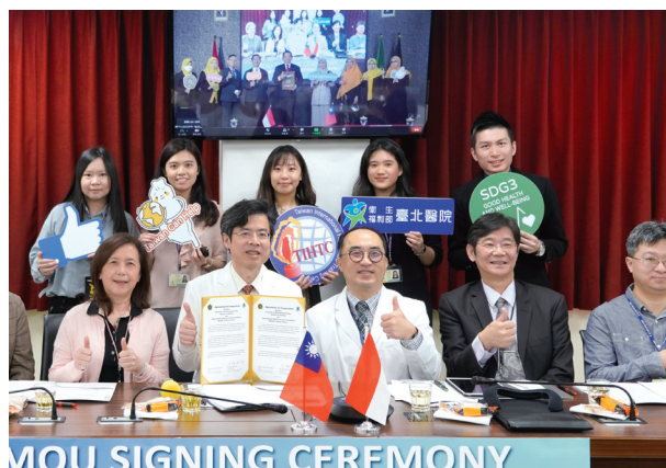
MOU SIGNING CEREMONY 衛福部臺北醫院與印尼中爪哇省穆罕默迪亞古突士大學(UMKU)簽訂合作備忘錄。

TIHTC 亦善用多年來累積具備豐厚全球醫衛人才資料庫之優勢，持續透過 Facebook 粉絲專頁及歷年參訓學員通訊網絡等方式，於疫情期間提供衛福部「臺灣嚴重特殊傳染性肺炎防疫關鍵決策網(Crucial Policies for Combating COVID-19)」、外交部「因應武漢肺炎國際分享專區(The Taiwan Model for Combating COVID-19)」、疾管署「醫院防疫總動員影片(CDC Hospital Strategy of COVID-19)」等資訊，