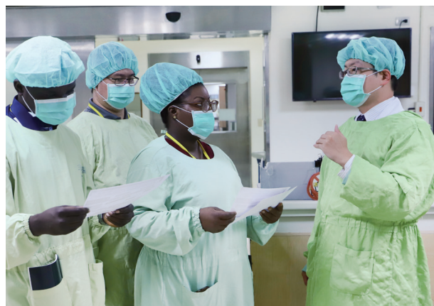
TIHTC開辦之「緊急醫療暨燒燙傷照護專案訓練課程」。

TIHTC透過與國內政府部門、學術機構、醫學會及協會合作，並攜手全臺超過 50 間醫療院所，建立「國際醫衛院際合作網絡」，廣邀全臺專業醫療團隊參與，整合全國醫療衛生資源及經驗，結合國內醫療機構之強項，建立完善的代訓機制，齊力規劃多元化的課程，共同提升培訓成效，提供國際級的專業訓練課程及技術指