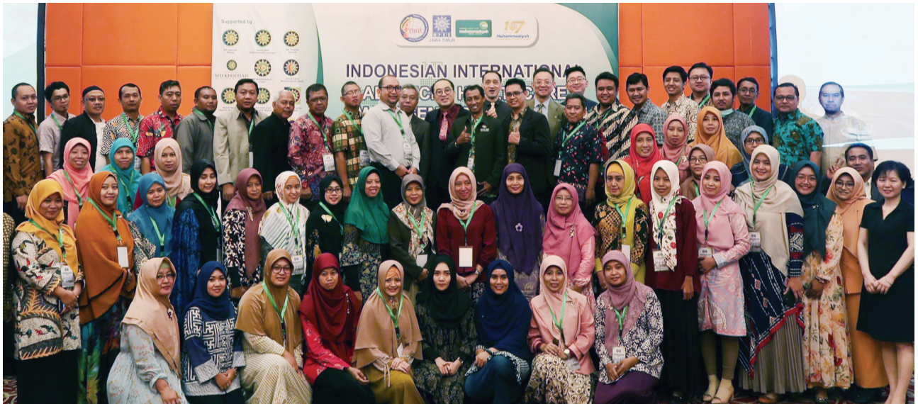
印尼穆罕默迪亞東爪哇醫院協會(Muhammadiyah Hospital Association, East Java)力邀TIHTC至印尼。

有鑑於此，TIHTC與時俱進，將原本實體專案課程全部搬上網路，廣發邀請函歡迎各國醫療從業人員線上參與，以「直播課程」及「預錄影片」方式雙軌齊下，讓參訓學員能在因疫情疲於奔命的狀態下，把握自己所擁有的零碎時間，按照自己的進度將一堂堂課補齊，雖無法實地到訪臺灣，但通過影片中所傳遞的知識，一點一滴地在腦中建構起對臺灣醫療系統的認知，並從中獲取可實際用於職場中的經驗分享，提升自身專業