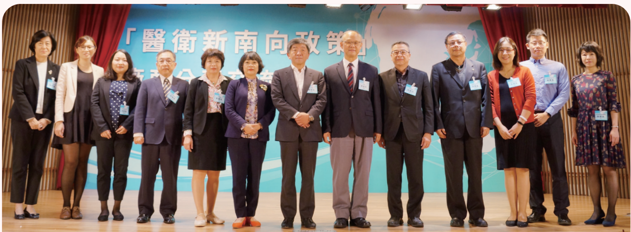
2019 年「醫衛新南向政策」廠商交流分享會，邀請五家代表廠商，分享在新南向政策施行下進入市場之實際經驗。

在國際醫療服務方面，主要以心血管治療、癌症治療、肝臟移植、生殖醫學為推動方向，進行高端醫療服務。自 2017 年至 2019 年，新南向國家來臺就醫人次呈現穩定成長近 40%，產值約增加 15.7 億元。2020 年迄今雖受 COVID-19 疫情影響，惟截至去（2021）年底新南向國家來臺就醫計 13.4 萬人次，占全部國際醫療病患 49%（國際醫療總人次約 27.2 萬）。