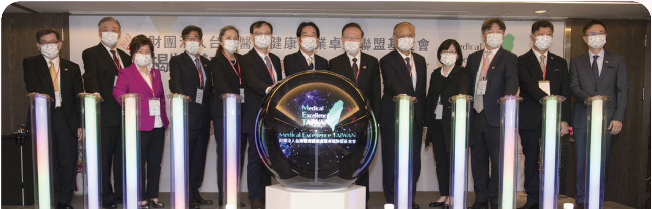
MET基金會於2022年4月舉辦揭牌儀式暨醫療健康產業專題研討會，以推動我國醫療及健康產業國際化為目標。

有鑑於此，為提倡我國醫療健康產業國際化、產業化，衛福部於今年度推動產官學界共組成立「財團法人台灣醫療健康產業卓越聯盟基金會 (Medical Excellence TAIWAN, MET)」，成為我國醫療健康產業國際化的核心單位，將持續協助聚攏醫療院所及健康醫療產業業者，建構資源網絡平台，發揮整合成效。