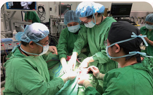
新南向一國一中心計畫克服新冠肺炎疫情困境，持續與印尼醫院交流，指導培訓印尼顱顏專科醫師進階手術。

醫衛領域特別能夠彰顯新南向政策「以人為本，共創互利雙贏」之精神，具備發揮臺灣軟實力之代表性。整體而言，醫衛新南向政策已見成效，在一國一中心的大力推動以及各方配合之下，新南向國家逐漸認知此政策帶來的重大意義，臺灣醫療機構與新南向國家的互動往來也更為密切。經由日益緊密的互動關係，不僅提升了新南向國家醫事人員來臺受訓認識臺灣的機會，