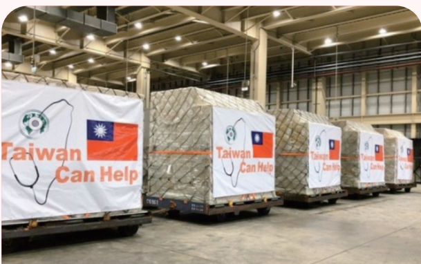
我國面臨 COVID-19 的威脅，但在防疫物資不虞匱乏的前提下，共同防堵疫情，展現「Taiwan Can Help」精神。

在過去四年我國藉由推動醫衛新南向計畫已奠定良好的合作基礎，未來衛福部將以「穩固基礎、擴大成效」為原則，推動醫衛新南向政策 2.0