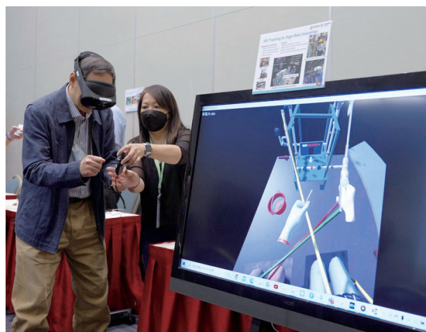
在口腔健康政策高峰會上，與會來賓參與數位口腔醫療體驗。